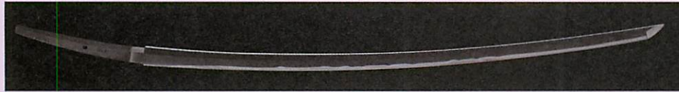
太刀 童子切安綱写し