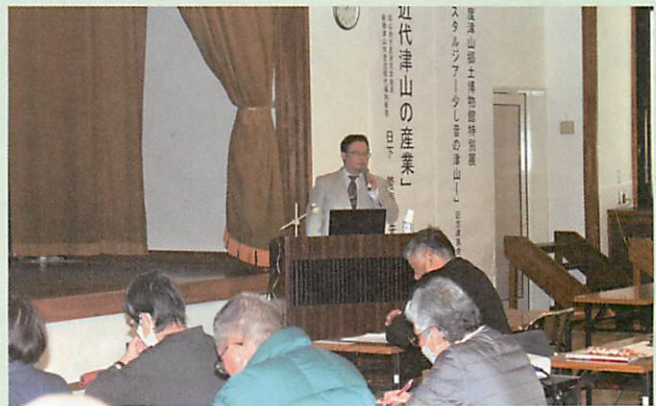
記念講演会のようす