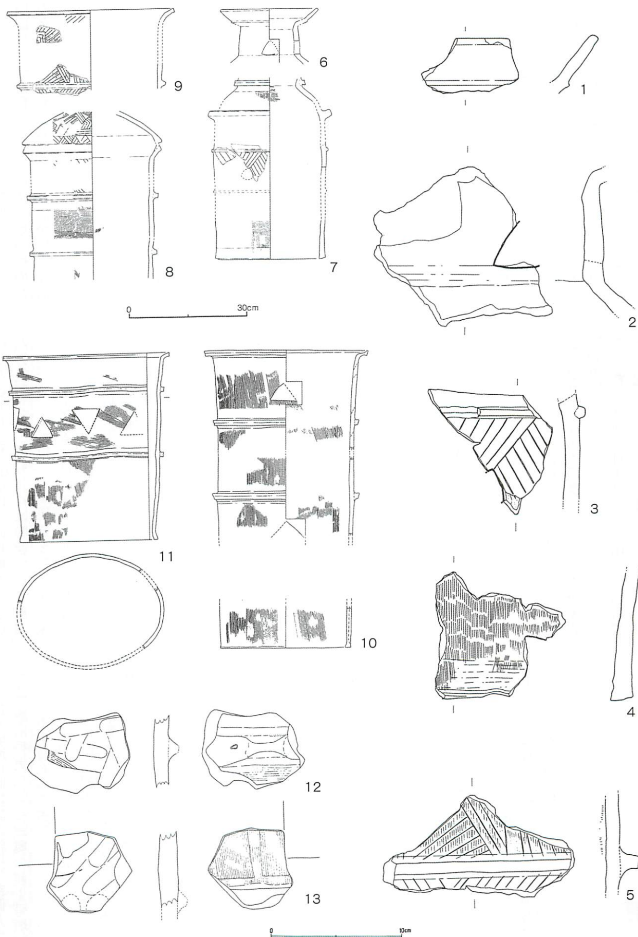
図1 美作地方前期古墳の埴輪 (1~5、12・13…S=1:3、6~11…S=1:10)