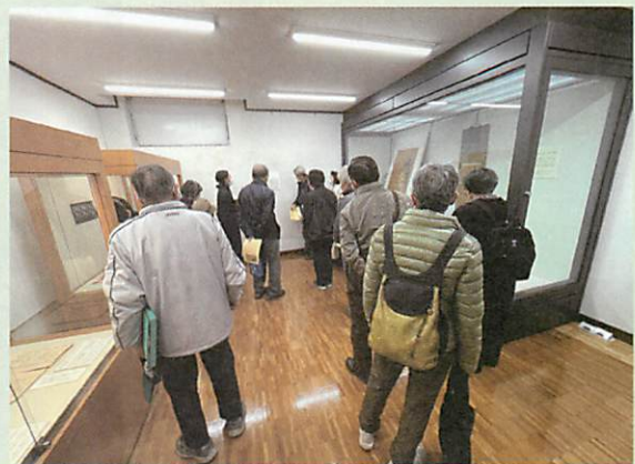
ミニ企画展のようす

令和6年、2024年の干支は辰です。令和5年12月23日（土）から令和6年1月14日（日）まで辰にちなんで、想像上の生き物である龍に関する資料を展示しました。龍は空を飛んで雲をおこし雨を呼ぶ霊力があるとされています。縁起が良いとされている富士山と昇り龍が描かれた画や、龍が水と密接に関わっていると考えられていたことがわかる資料などを展示しました。