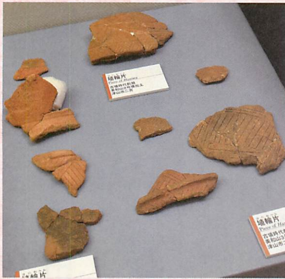
写真1 埴輪展示風景

古墳時代の展示コーナーに美和山古墳群の埴輪を展示している(写真1)。美和山古墳群は津山市二宮に所在し、前方後円墳1基(1号墳)と円墳3基(2・3・6号墳)で現在構成される。1号墳は全長80m、美作最大規模を測り、2・3号墳も直径34・36mの大形円墳で、国指定史跡となり、古墳公園として整備されている。整備に先立ち、確認調査され1〜3号墳には河原石による葺石があり、埴輪片がかなりの数出土している(註1)。この埴輪の紹介と美作地域の埴輪の有無などによる前期首長墳の様相について考えてみたい。