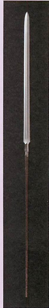
大身槍 （岡山県指定重要文化財）