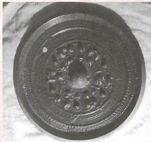
写真1 三角縁波文帯三神二獸博山炉鏡(註4より引用)

津山市で確認できる三角縁神獸鏡はこれが唯一であるので、もし借りる事が出来たら是非展示したいものである。くしくも令和6年度の特別展は、美作津山の古墳時代をテーマにする予定なので、その目玉になったはずである。