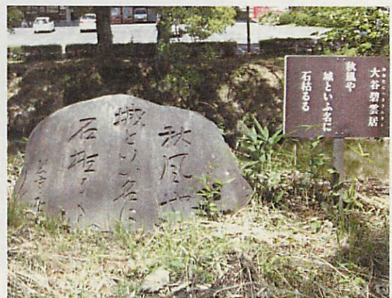
鶴山球技場入口句碑「秋風や」