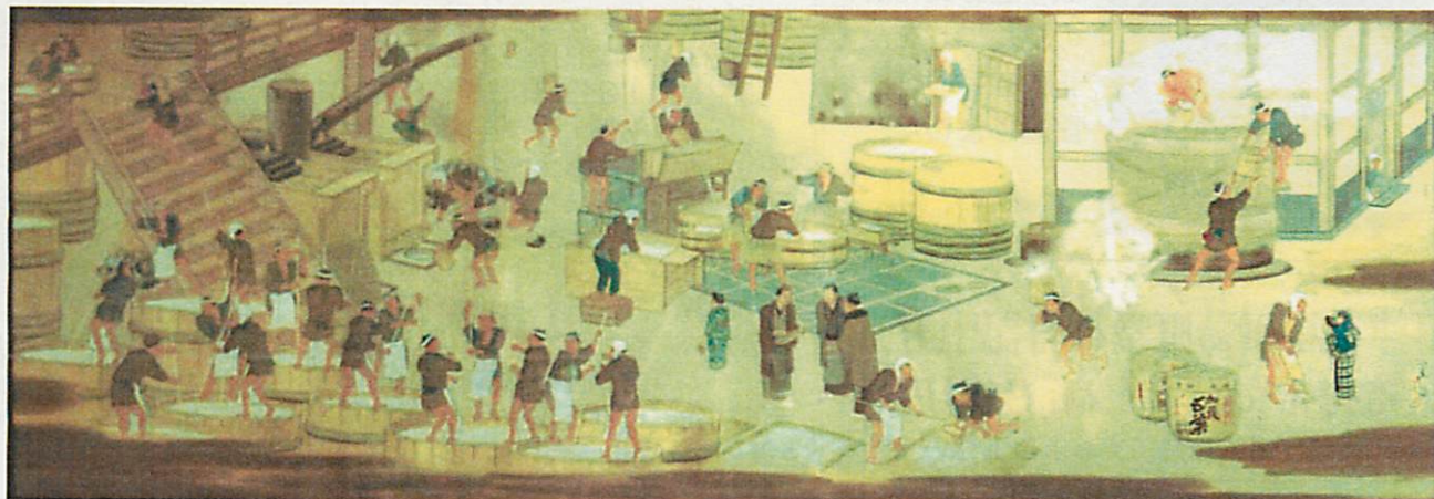
▲江戸時代の酒造場の図（個人蔵）